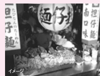
高雄 六合二路夜市 飲食と雑貨類の屋台が多く出る高雄一の夜市。港街らしく海鮮が多くエビの塩蒸しが特に有名です。