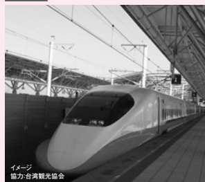
台湾新幹線 台北から高雄左営まで全長約345キロを最速約1時間半で結び。