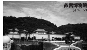
故宮博物院 (イメージ)

午前:行天宮(下車)、中正紀念堂(下車)、總統府(車窓)、お茶セミナー、エバーリッチ免税店へご案内。 昼食:鼎泰豐レストランにて小籠包 午後:故宮博物院(入場90分)、忠烈祠、民芸品店ショッピングへご案内。